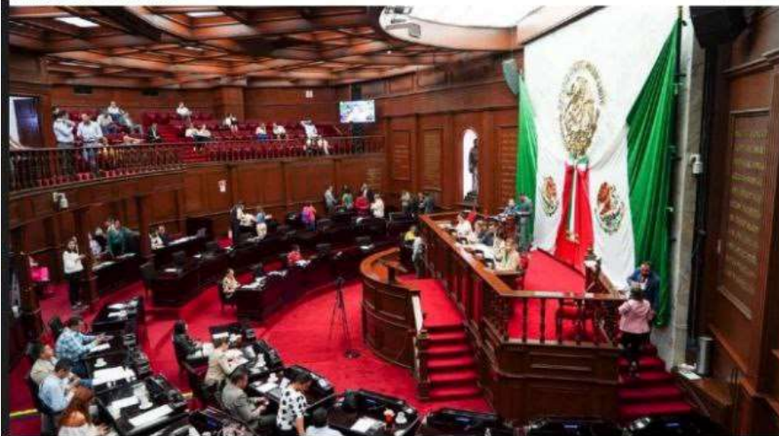
MORELIA, MICH.- Reforma que plantea la interrupción legal del embarazo hasta las 12 semanas, y la cual no prevé derogar como tal el delito.

Certificación de huertas de aguacate para exportación, podría perjudicar a pequeños productores: Medio Ambiente