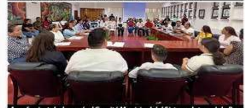
Ayer fue instalado aquí, el Comité Municipal del Sistema Integral de Protección de Niñas, Niños y Adolescentes (SIPINNA).