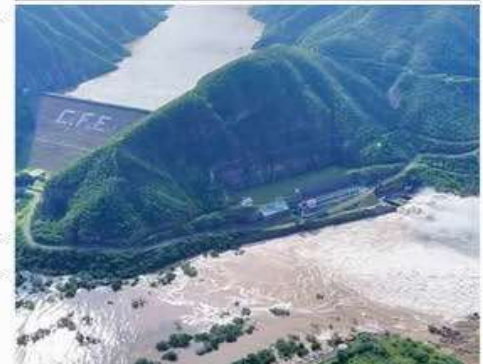
Datos de la CNA señalan que la presa Infernillo todavía sigue en 110.8 por ciento de su capacidad de almacenamiento, por lo que el desfogue continuaría hacia La Villita y esta a su vez hacia el río Balsas.