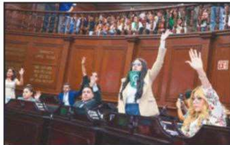
LEGISLADORAS Y LEGISLADORES APROBARON EN EL PLENO LA DESPENALIZACIÓN DEL ABORTO EN EL ESTADO, LUEGO DE AÑOS DE LUCHA.