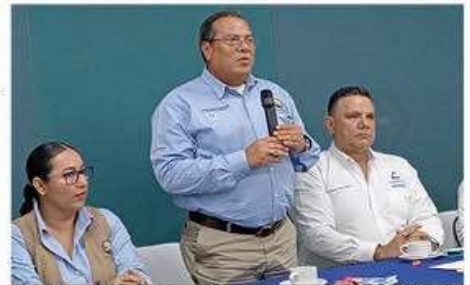
Vicealmirante Anselmo Osorio Fraga, director general de ASIPONA-LC, reiteró que el Distribuidor Vial no existe más. Se proyecta hacer un Periférico de La Orilla hacia Guacamayas y de ahí a la Isla de la Palma y la autopista.

Morelia, Michoacán, a 10 de octubre de 2024.- El Poder Legislativo de Michoacán atendió la resolución de la Suprema Corte de Justicia de la Nación y aprobó las reformas al Código Penal del Estado que permiten la interrupción del embarazo durante las primeras doce semanas de gestación, evitando la criminalización de las mujeres y personas gestantes que así lo decidan, para garantizar su derecho a decidir libremente. Las y los integrantes de la 76 Legislatura formalizaron así la despenalización del aborto, para con ello armonizar la legislación vigente en la materia, que declara la inconstitucionalidad » 7