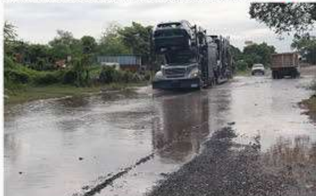
La segunda etapa de la ampliación del libramiento carretero de la ciudad, está a la espera de su autorización en el presupuesto federal de Hacienda del 2025, de lo contrario, la obra se retrasaría hasta el 2026, según la ASIPONA-LC.

Tras reconocer que es un verdadero problema transitar, entre otros sitios por el llamado libramiento Sicaritsa-La Orilla, en la parte en donde todavía no se » 9