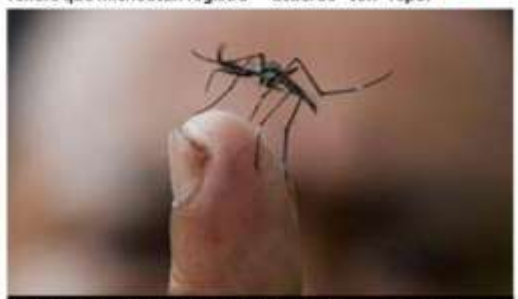
Al cierre de la 40 semana de este 2024, se reportaron dos nuevos decesos por dengue en Michoacán.