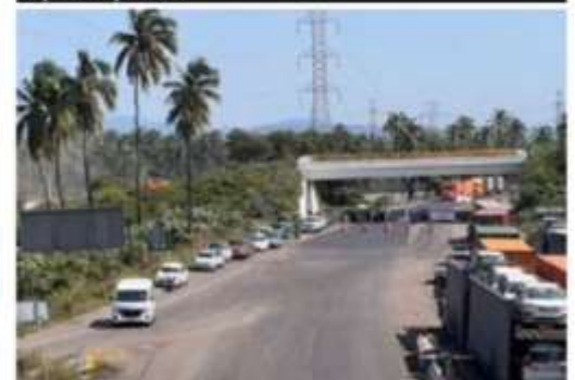
En demanda de la solución a diversos problemas, habitantes de la comunidad indígena de Zacatula, municipio de La Unión, Gro., bloquearon por varias horas la autopista siglo XXI, a la altura del kilómetro 306.