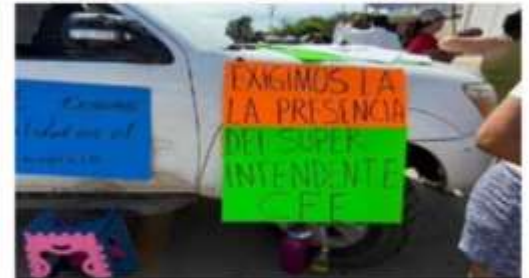
A través de cartulinas, los inconformes hicieron saber la problemática por la que están pasando.

Pobrecita, tan poco entendida, engañada y vituperada, en su día es un bonito detalle de nuestra ➤ 2