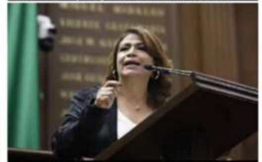
Urge a revisar mecanismos de derechos humanos implementados por la policía capitalina.