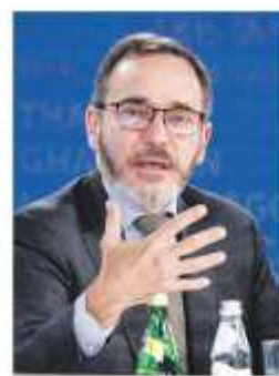
Gaurincha. 'Hay una creciente incertidumbre en la economía mundial'.

El estimado de crecimiento para México observó el mayor recorte entre las principales economías, tanto para 2024, de 2.2 a 1.5 por ciento, como para 2025, de 1.6 a 1.3 por ciento. PÁG. 4