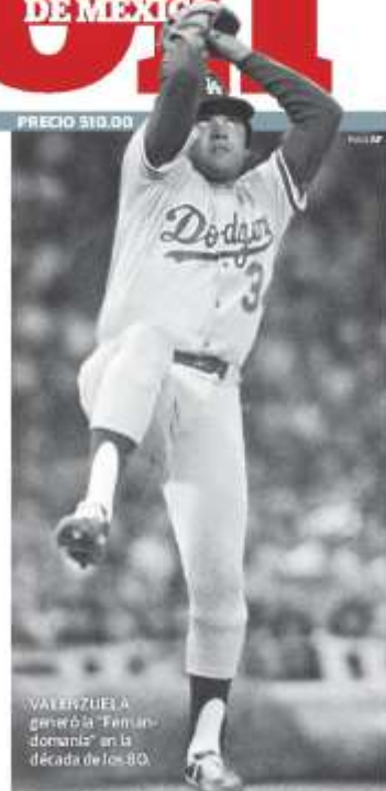
VALENZUELA generó el "Fenómeno" en la década de los 80.