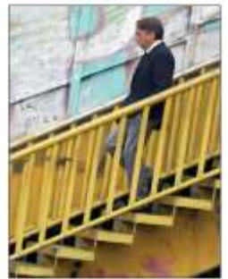
▲ El hasta ayer presidente del consejo de administración.

● Por primera vez, el consorcio no será liderado por alguien de la familia