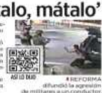
REFORMA difundió la agresión de militares a un conductor.

violencia criminal. Mientras que en Milotlán, Veracruz, donde grabaron la cabeza de un hombre frente a las instalaciones de la delegación de Toluca estatal. Hace dos semanas y medio que tanto en el caso de Culiacán, como en el de Chiapas donde militares dispararon contra migrantes, hay investigaciones en curso. "No vamos a permitir que haya ejecuciones fuera de la ley", comentó.