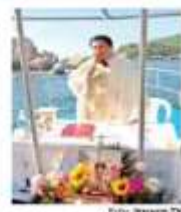
El padre reza por los marzanos desaparecidos hace un año.