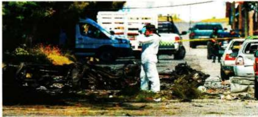
Un perito trabaja en la escena donde explotó un coche bomba cerca de una comisaría en Acámbaro, estado de Guanajuato.