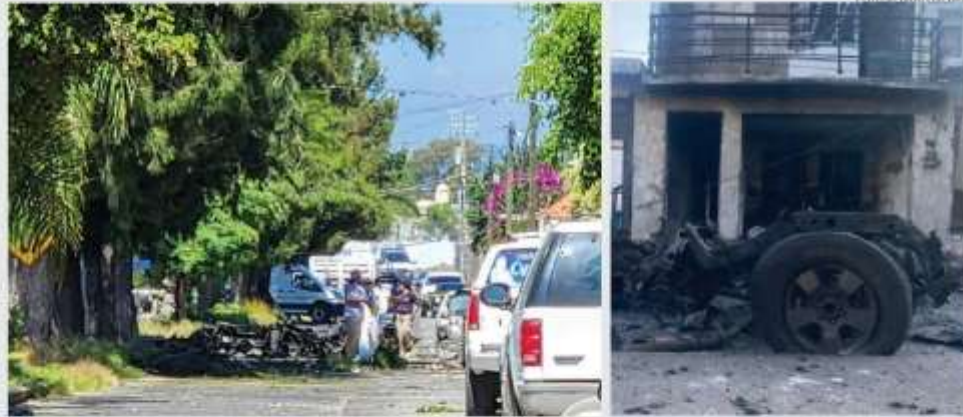
En el estado los niveles de violencia son alarmantes, ayer estallaron autos en Acámbaro y Jerécuaro. PAG. 6