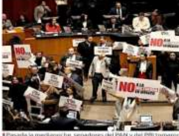
Protesta de medios y senadores del PAN y del PRI tomaron la tribuna con pancartas en las que se leía: "No a la dictadura".

REFORMA / STAFF Emilio Azcárraga Jean dejó la presidencia de Grupo Televisa por tiempo indefinido en medio de una investigación del Gobierno de Estados Unidos sobre los negocios del conglomerado de medios mexicano en el fútbol internacional. En su reporte financiero al tercer trimestre del año, la compañía informó que el Consejo de Administración aprobó que Azcárraga tomara una licencia del cargo, en tanto se resuelve la investigación que lleva a cabo el Departamento de Justicia estadounidense, relacionada con la Federación Internacional de Fútbol Asociación (FIFA). "El Consejo de Administración aprobó una propuesta del señor Emilio Azcárraga Jean, presidente ejecutivo del Consejo, para tomar licencia, con efecto inmediato, en tanto que continúa la investigación que está llevando a cabo el Departamento de Justicia de Estados Unidos, relacionada