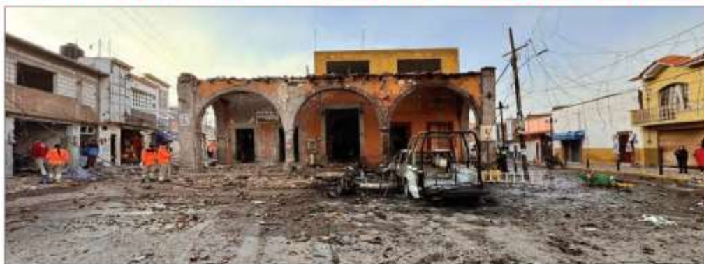
▲ Casi a la misma hora, integrantes del crimen organizado hicieron estallar ayer por la mañana dos vehículos con explosivos en Acámbaro y Jerécuaro, con saldo de tres policías heridos, así como 11 autos

Estallan explosivos en Guanajuato y refriega deja 16 muertos en Guerrero