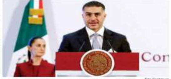
La presidenta Sheinbaum y Omar García Harfuch, titular de la SSP, encabezaron la presentación del informe de seguridad.