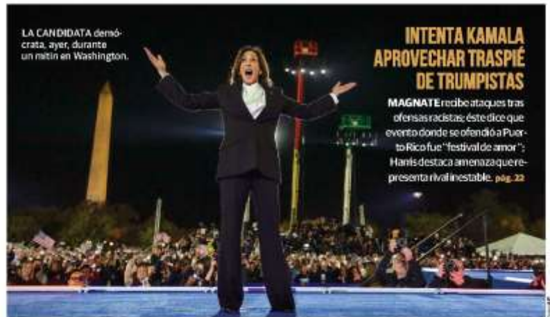
LA CANDIDATA demócrata, ayer, durante un mitin en Washington.