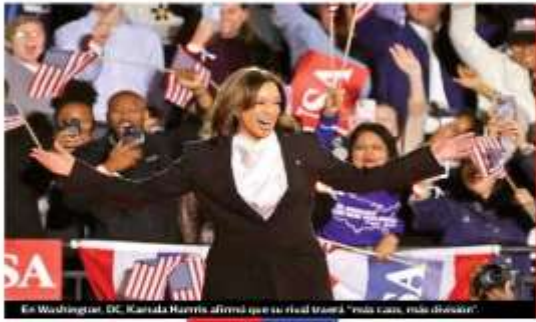
En Washington, DC, Kamala Harris afirmó que su rival tendrá "más caos, más división".