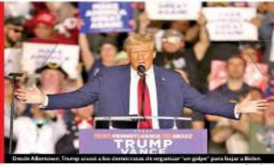
Desde Alabama, Trump alentó a los demócratas de organizar "un golpe" para bajar a Biden.