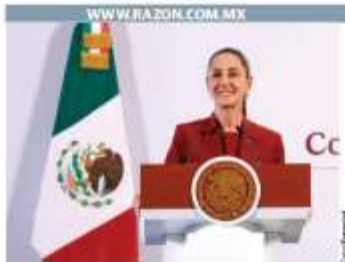
LA MANDATARIA , ayer, durante su conferencia en Palacio Nacional.