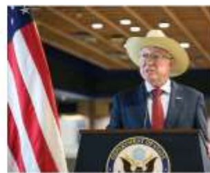
EL SECUESTRO está en estado y nosotros tenemos que conocer la información, por eso venimos a tener la obligación de dar esa información"

Embajador Salazar responde que ni es su piloto ni su avión; niega operación en suelo mexicano; se han dado todos los datos, dice; va victoria grande con detención págs. 3 y 4