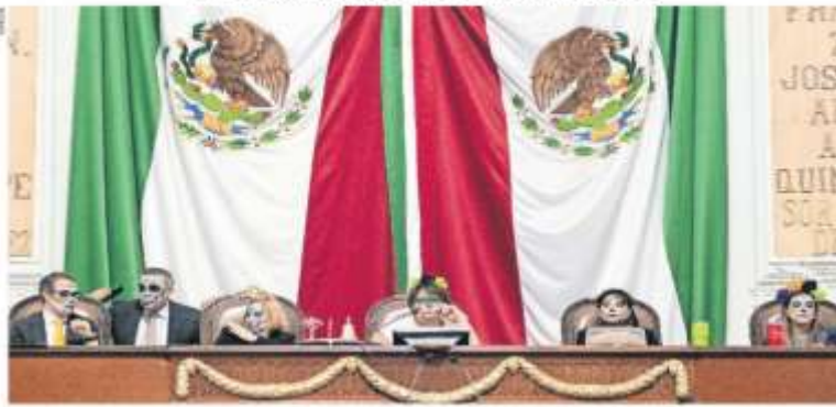
Impugnación en el Día de Muertos, los miembros de la Mesa Directiva del Congreso de la Ciudad de México se plantaron el rostro de calaveras y catrinas, durante la sesión ordinaria en la que se aprobó el dictamen de reformas al Código Fiscal para implementar la licencia de conducir permanente.