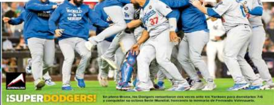
¡SUPER DODGERS! En plena Bronx, los Dodgers celebraron dos veces ante los Yankees por derrotarlos 7-6 y completar su octavo Serie Mundial, homenaje a la memoria de Fernando Valenzuela.